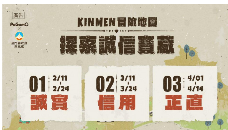
遊戲平台內彈跳廣告宣傳圖。