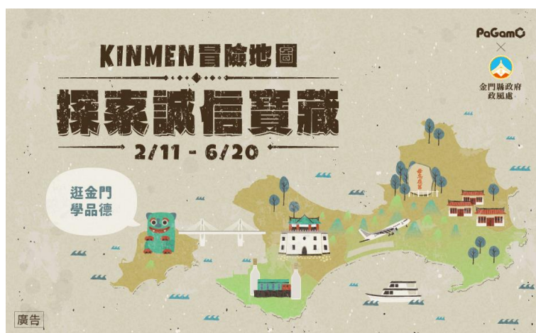
活動宣傳主視覺圖。